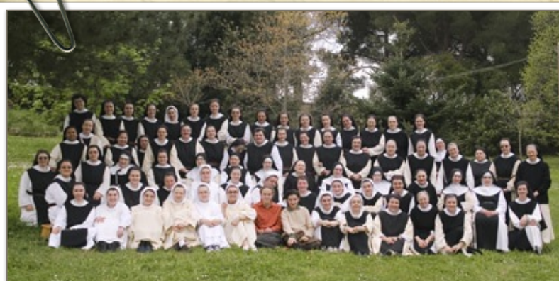
Communauté actuelle au monastère de Vitorchiano

«Elle fut une vraie cistercienne par son silence d'amour, sa quête de Dieu, son obéissance et son humilité.»