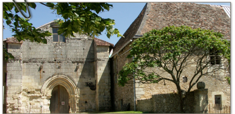
Ruines de l'Abbaye de l'Étoile fondée au 12 e siècle