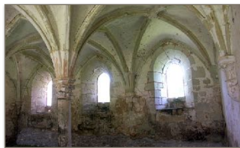
Salle du Chapitre