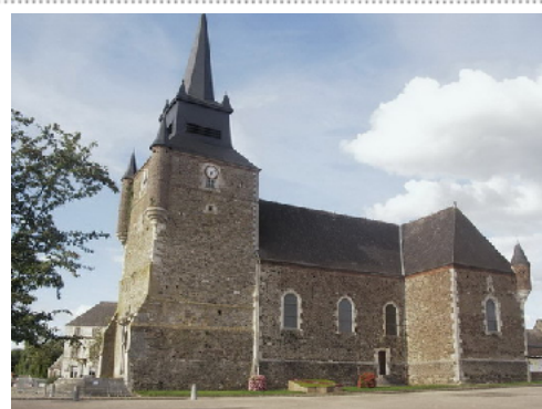
Église de Signy