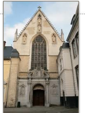
L'église de l'Abbaye

L'Abbaye de la Cambre, fondée en 1201, a été supprimée lors de la Révolution française, et vendue comme bien national en 1796. En 2013, des Chanoines Prémontrés de l'Abbaye de Leffe s'installent dans l'ancienne Abbaye.